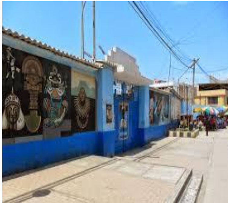
2.- Local nuevo de la I.E Casa Grande