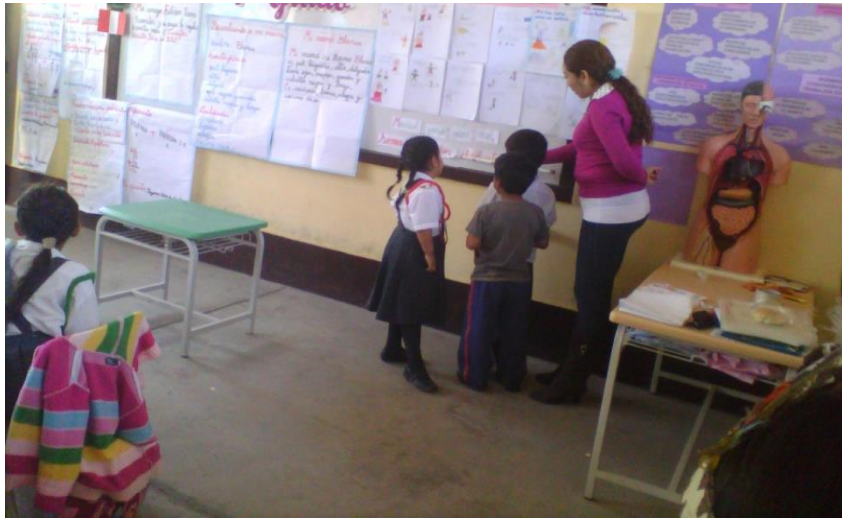
Monitoreando a la docente