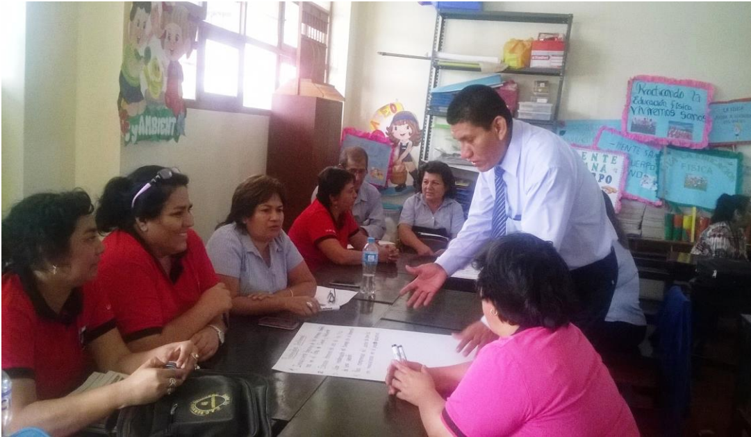
Foto: Directivo escolar junto con los docentes durante la jornada de identificación de la problemática de la IE. 81902- Pacanguilla.