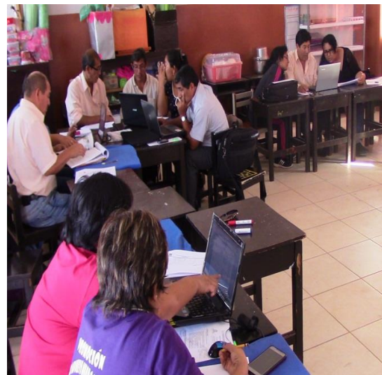
Foto: Plana docente de la IE.81902, socializando con el directivo sobre los aspectos del monitoreo Pedagógico.